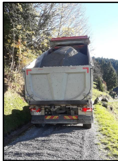
Strassensanierung im Unterschössli