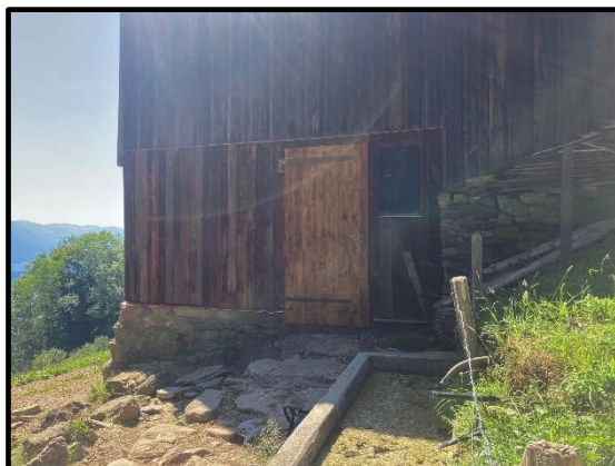
Neue Türe im unteren Fähbergstall