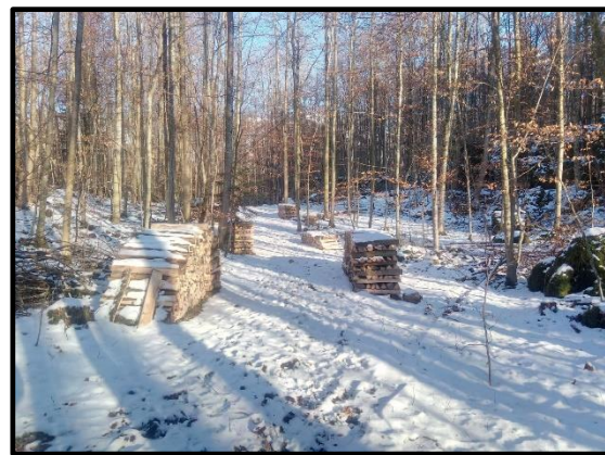
Aufbereitetes Brennholz im Gasterholz

Die Bürgerversammlung findet am Samstag, 4. März 2023 um 20.00 Uhr in der Kirche Maseltrangen statt.