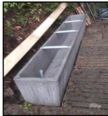
Transport des neuen Brunnens in die untere Steinegg