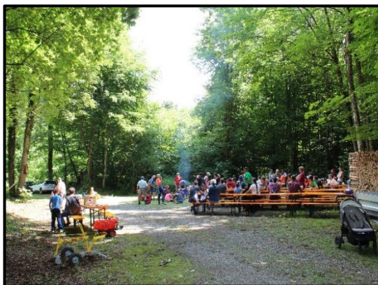
Einwohneranlass im Gasterholz